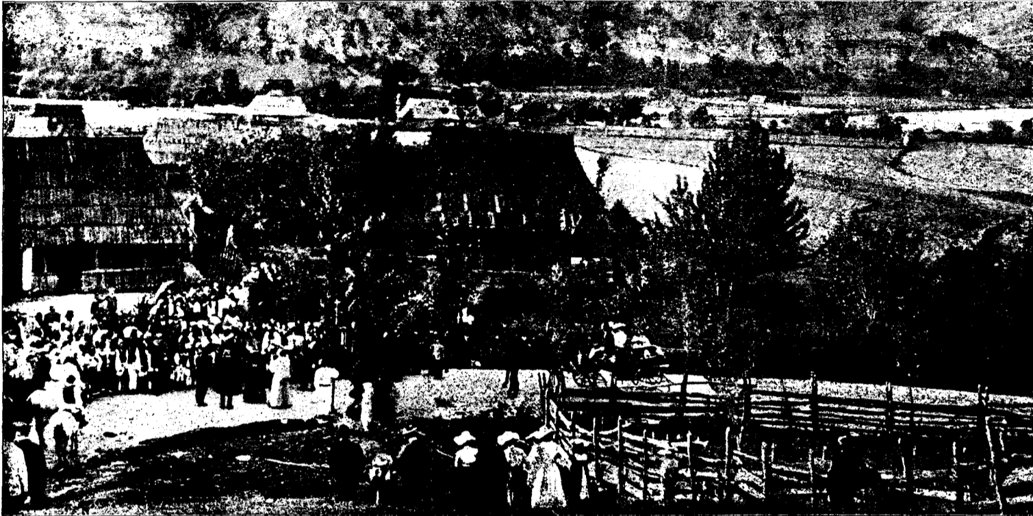
Primirea Episcopului Dr. Hossu în Coroeșteni de Jiu.