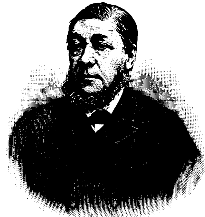
† Paul Krüger.

Să nu se simtă oare lipsa de a mai lumina aceasta împărăție a sufletului vecinic, de a mai plivi din acestea burueni, pe cari azi așa de puțini le bagă în samă? Să nu fim noi oare vrednici, ca să ne ridicăm odată pe înălțimea, de pe care să vedem limpede și să cunoaștem, cari sunt adevăratele noastre lipse și ajutoare , pe cei ce nu voesc binele, și pe cei ce voesc să trăească de pe spinarea noastră? Să nu fim oare vrednici, ca odată să nu mai stăm răci și nepăsători atunci când e vorbă de sufletul nostru, de fericirea noastră? Ar fi bine, nu-i vorbă să avem mai mult loc, să putem presăra totuși mai multe știri mai însemnate din țară și din străinătate. Am dori să ne rămână loc mai mult pentru »foiță«, dar cu spațiu, de care dispunem acum, facem cum numai se poate. Dela sprijinul, ce ni s'ar da,