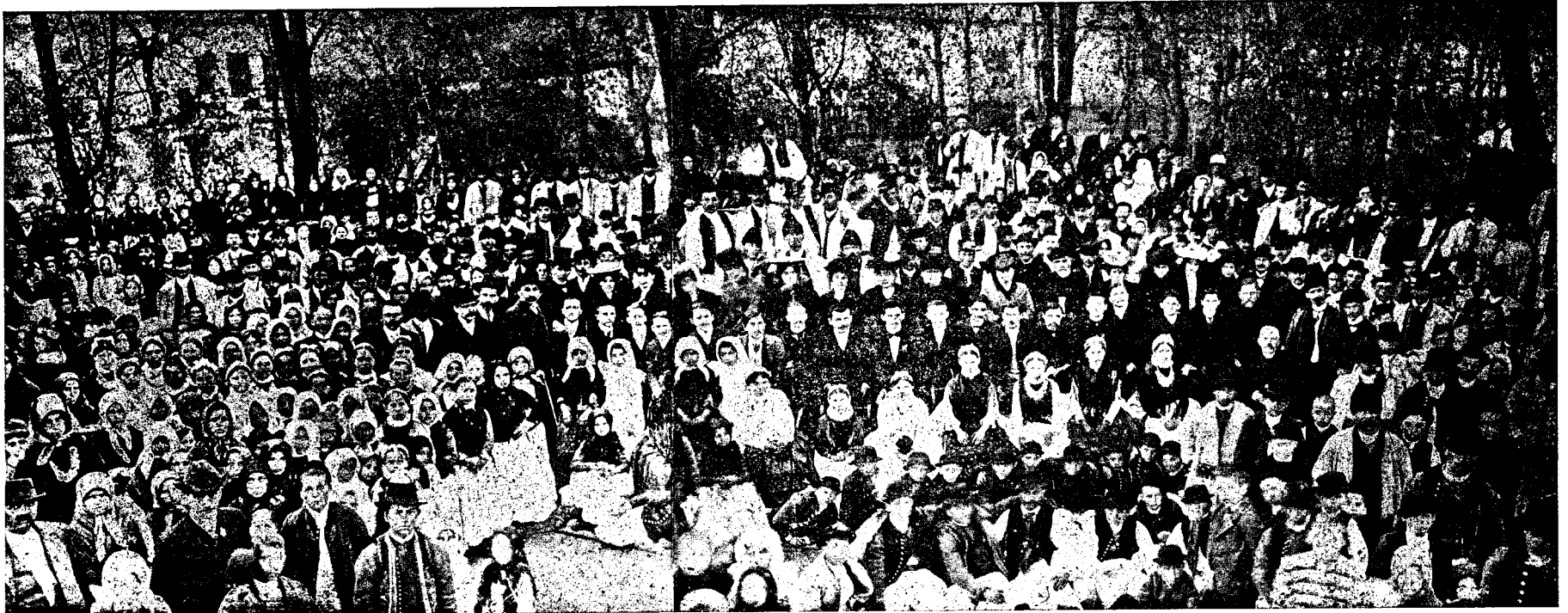
O adunare de domni și țerani români în Ghioroc, lângă Arad.