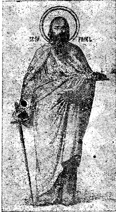
Sf. Pavel, Apostolul tuturor neamurilor

tează și Zorobabel, după ce sub conducerea lui Esra și Uemia, Iudeii s'au întors din robie. În