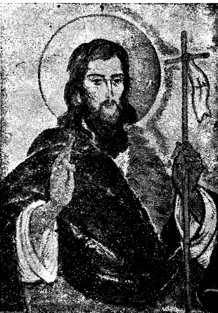
Sf. Ioan Botezătorul

Dar în noi nu-i numai trup, ci și suflet, acea putere nevăzută, cu care simțim, gândim și voim. Prin ea ne