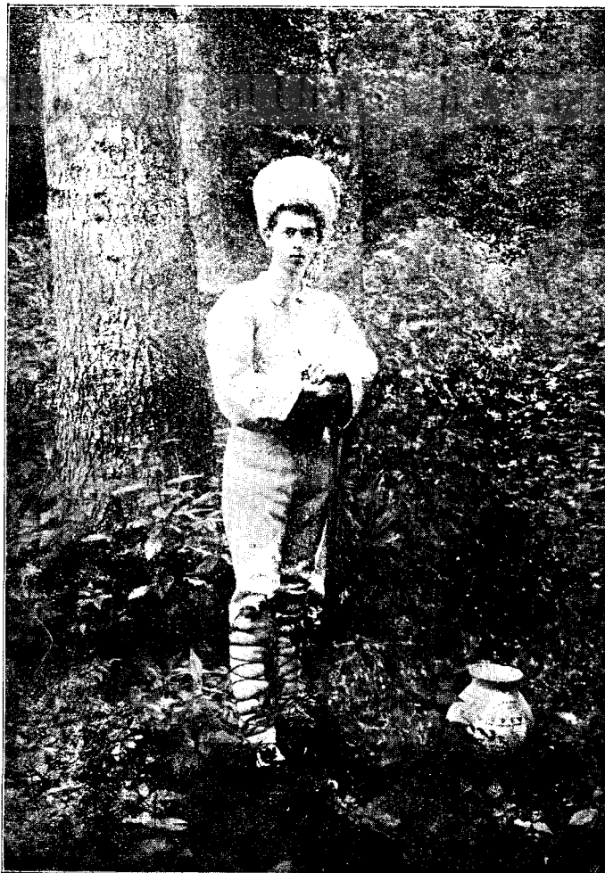
A. S. R. Principele Carol în costum de cioban.

Mulți factori și-au luat partea lor din crearea situației noastre actuale; partea leului însă să atribue clasei intelectualilor, respective conducătorilor naturali ai țărânilor, cari pre lângă tranșarea măruntelor afaceri private au stăruit mult-puțin și pentru înălțarea neamului. Să zicem, că intelectualii noștri în genere și-au achitat datoria lor față de națiune, cu toate-că e proverbială nepăsarea unora față de tot, ce e chemat să dea altă înfățișare colinelor și traiului românesc. Constatarea acestui rău însă nu să ține de