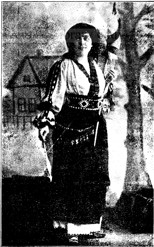
Costum din Toplița.

Credem, că suntem îndreptățiți a fixa măcar în parte condițiile, fără de cari — după modesta noastră părere — un internat academic în Cluj