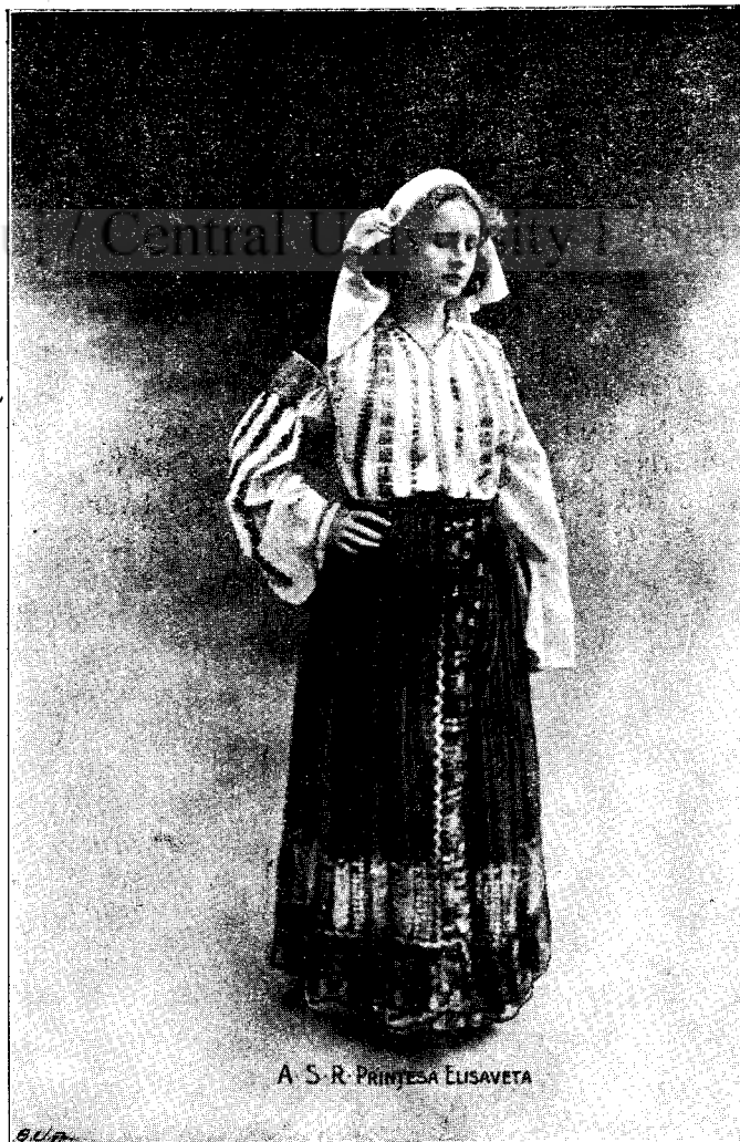
A. S. R. PRIMĂSA ELISAVETA

O muncă uriașă să așteaptă dela cărturarii Români, prin urmare și dela studențime pe terenul delăturării analfabetismului, care taie aripile oricărui avânt spre înaintare. Eil și dacă cutare tinăr din anii trecuți a dovedit rezultate frumoase în instruirea analfabeților în vre-o comună din Bănat, nu i-s'ar mai află oare căți-va tovarăși la o muncă atât de sfântă a regenerării masselor?! Să încerce numai fiecare în comuna sa și vom vedea, câtă mulțumire sufletească ne va produce faptul pornirii neștiutorilor de carte pe calea învățaturii!