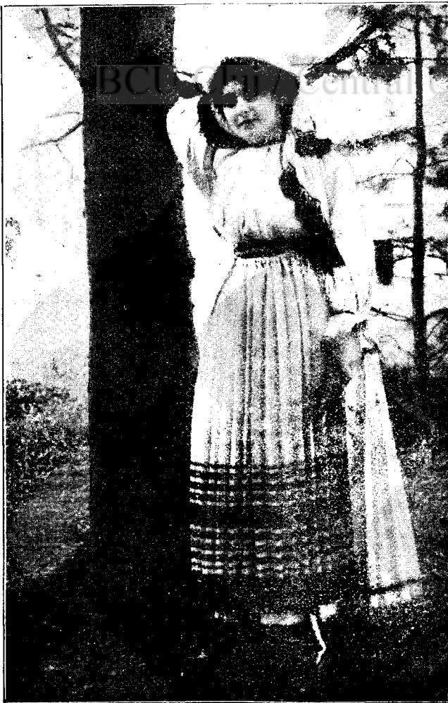
Costum din Orăștie.

Iar în urmă, ca să dăm dovadă, că suntem vrednici a nu mai fi copii nimănuiei, ci să avem un părinte bun: »Internatul Petran«; ca să dovedim, că nu numai cere, dar și jertfi știm din mult-puținul nostru, noi subsemnații promitem pe cuvânt de onoare și cu jurământ sfânt a plăti