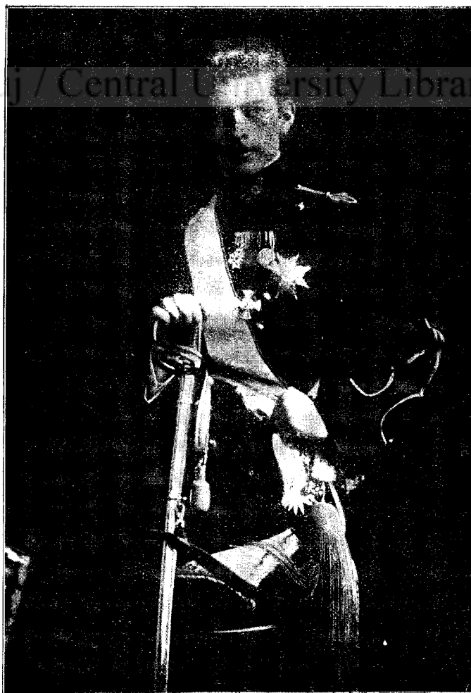
A. S. R. Principele Carol în uniformă de locotenent în batationul 6 de vânători.

Prima fotografie ni 'L arată pe Alteța Sa în atitudine gânditoare, pare că ar fi în mijlocul studiilor, aprofundând o problemă de viață adânc tăietoare în viitorul său. Aceasta atitudine de conștientioasă datorință trebuie să fie în sufletul