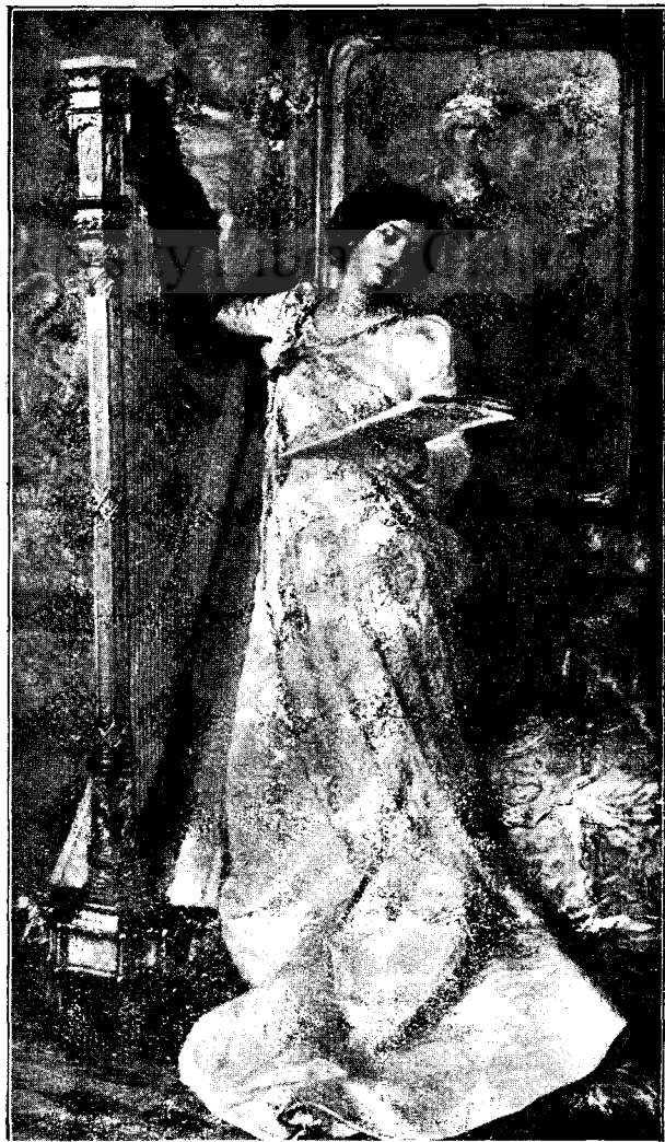
A. Mollica: O elegie. După originalul din salonul parisian 1912.

Cererea noastră atât de justă se poate îndeplini cu ocaziunea petrecerilor, balurilor, concertelor etc., când tinerii vrând-nevrând ar trebui să dea jertfa datorită fiecărui bun Român. Numai așa am putea pași cu nădejdi mai sigure pe drumul apucat, numai așa am putea zice, că iată