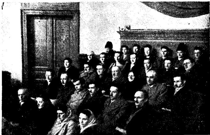
A kongresszus résztvevőinek csoportja nagy figyelemmel hallgatja az előadásokat

Mit kíván új államéletünk a szervezett méhésztől? Eszserúsítenie és korszerűsítienie kell minden méhésztnek, a tudományos méhésztet eredményeinek igénybe vételével, saját munkáját. Elért eredményeit lapunkon keresztül a méhésztetek közkincsévé kell tennie. Így biztosítjuk méhésztetek fejlődését a közösségi munka segítségével. Legyen takarékos minden méhészt élettevékenysége minden ágazatában, hogy annál könnyebben teljesíthesse az állammal, a közösséggel szemben fennálló köteleességét. Vállaljon mindenki tehetsége szerint áldozatot egyesületünkön keresztül a kísérleti telepek, a közösségi méhé-