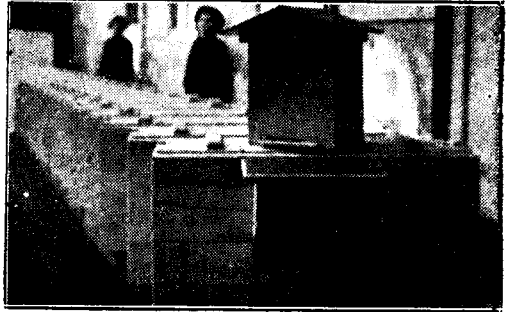
20 keretes erdélyi fekvő kaptárak. A tetején anyának való

Ujabbban a mülépet egyszerűen a felső lécen levő előre kivágott résbe helyezzük és minden kerethez mellékelünk kis léccel van elkészítve, csupán úgy a költőtérben