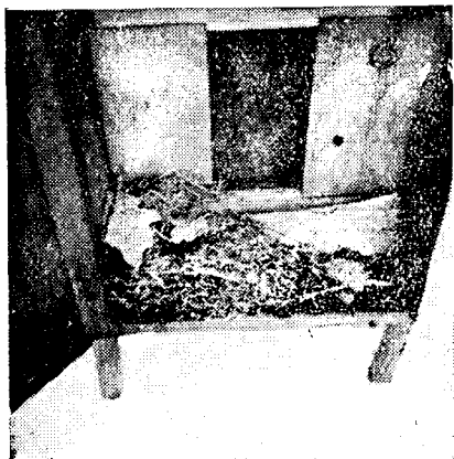
Egérfészkek országos kaptár ablakmögötti részében.

a kijárónál 2—3 cm-el hosszabb és 1 cm-el magasabb szalagot vágunk és az egyik élén 6—6 mm-re bevágjuk olyan távol egymástól, amekkora téli és tavaszi kijárót óhajtunk hagyni. A vágások közötti bádogrészt visszahajlítjuk és a két oldalán lyukakat fúrunk.