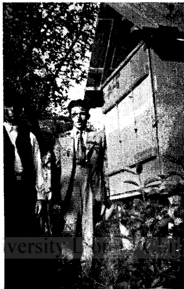
2. Feljegyzésez kaptárajtók, balról a gazda.

egy kas méhet, az el is pusztult. 1923-ban egy utórajt szerzett. 1924-ben lett 3 raja. A következő évben készítette az első kaptárt.