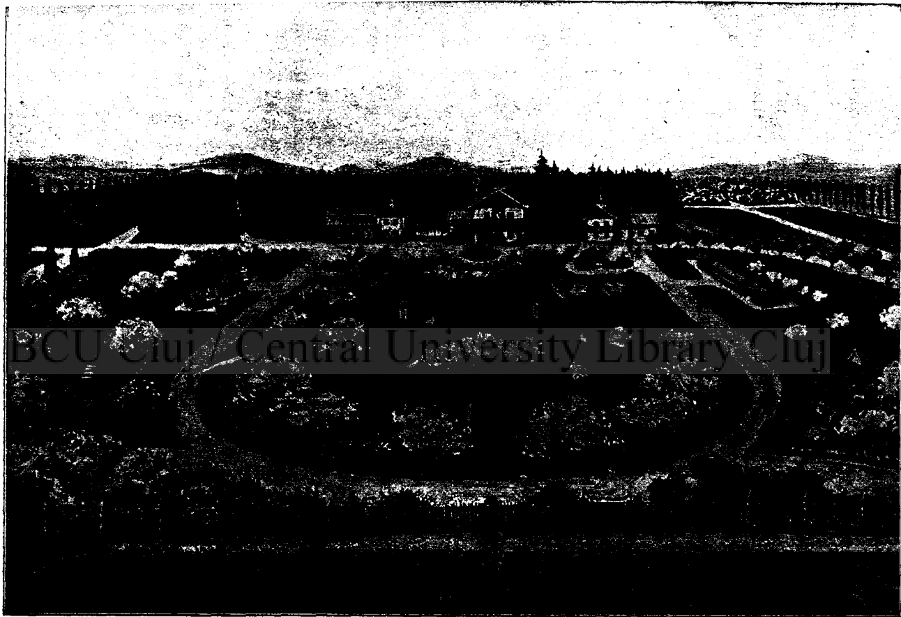
Magyar királyi állami méhészeti gazdaság Gödöllőn.