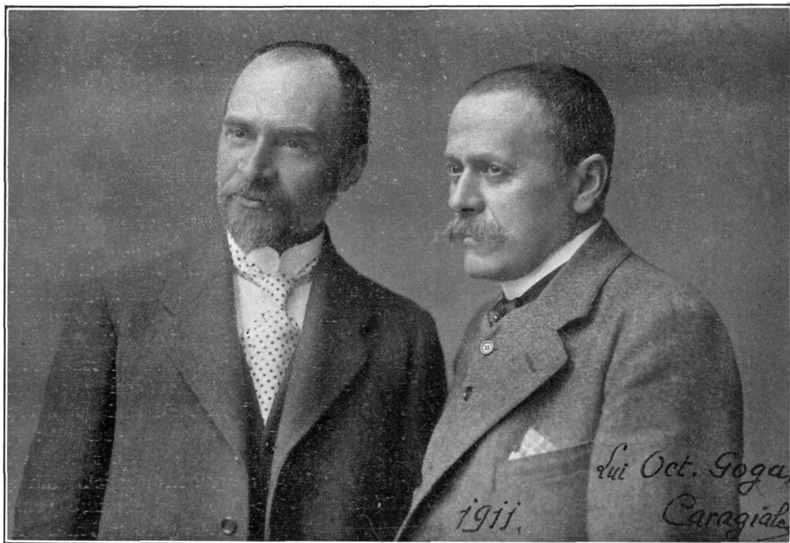
BCU Cluj / Central University Library Cluj