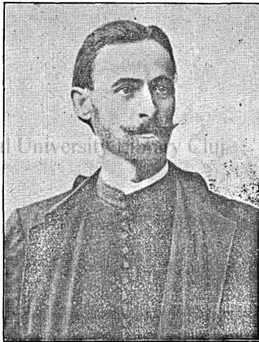
Protopopul TRAIAN MAGIER (1865—1909).

vieții noastre publice, în anul 1907, preotul Traian Magier din Saturău a fost ales și ridicat la treapta de protopresbiter al Butenilor, unde se și mută la această dată. N'a avut însă răgazul să se bucure mult timp de binemeritata distincție, căci surmenat de o activitate prea intensă și asiduă, fizicul său plăpând sucombă, murind într'un sanatoriu din Budapesta la 3 Iulie 1909 în etate de 44 ani. A fost adus și înmormântat la Buteni n 6 Iulie, același an.