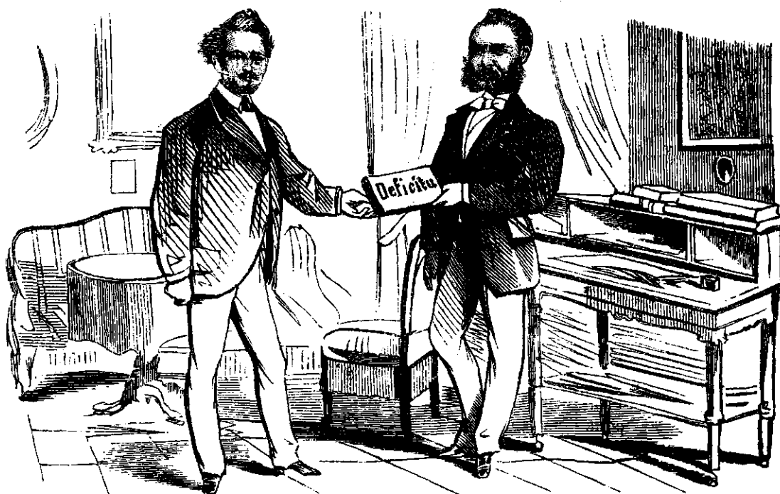
Fostulu ministru-redactoru predă portfoiulu urmatoriului seu, cantandu : Frundia verde, lemnu uscatu, Facu-mi cruce c'am scapatu !

Proprietariu, redactoru respundiatoriu si editoru : Iosifu Vulcanu.