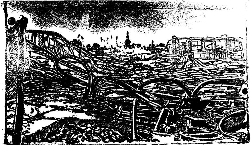
Ruinele rămase după foc.