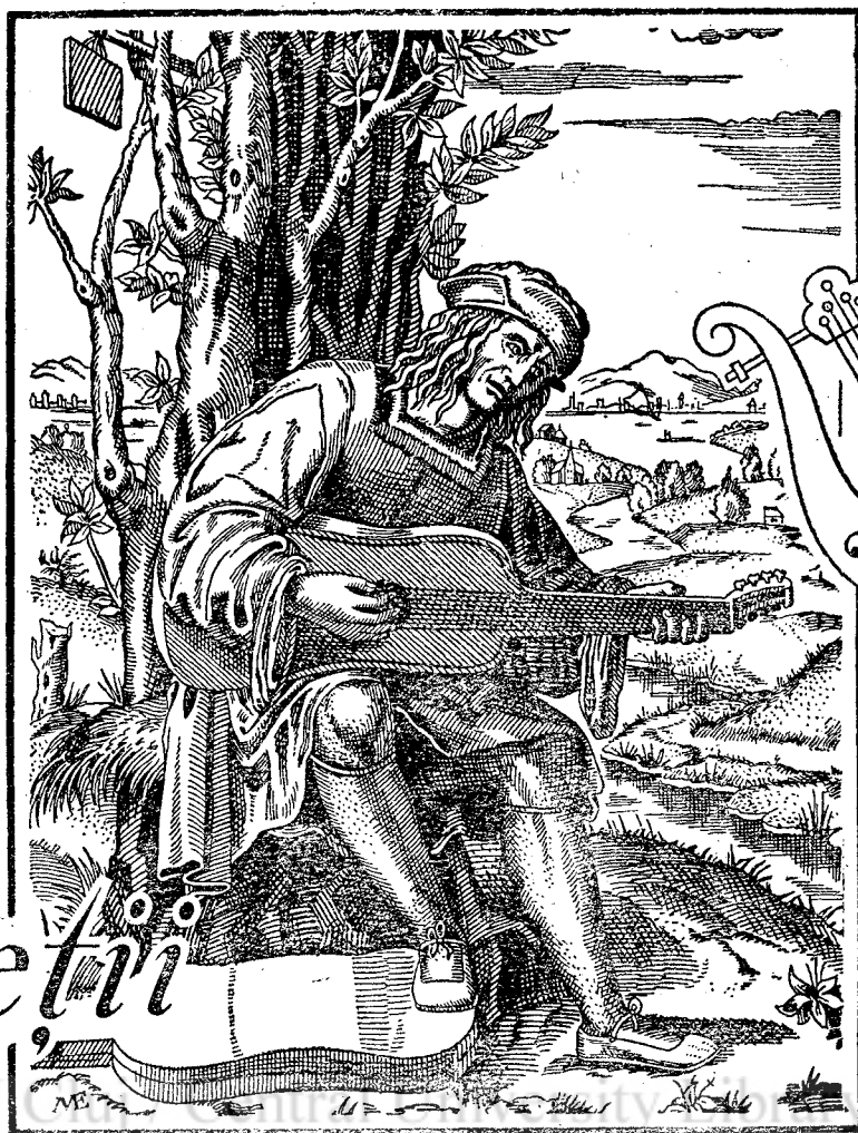
După o gravură din Secolul al XVI-lea a lui Marcantonio Raimondi.