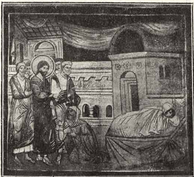
Hristos înviază pe fata lui Iar

BCU Cluj / Central University Library Cluj Miorcani, 1923, Septemvrie