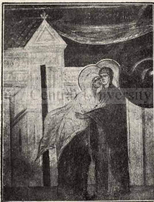
Intâlnirea Precistei cu Elisabeta

Tot mai departe șovăiu pe drum — și ca un ucigaș ce-astupă cu năframa o gură învinsă — închid cu pumnul toate izvoarele pentru totdeauna să tacă, să tacă.