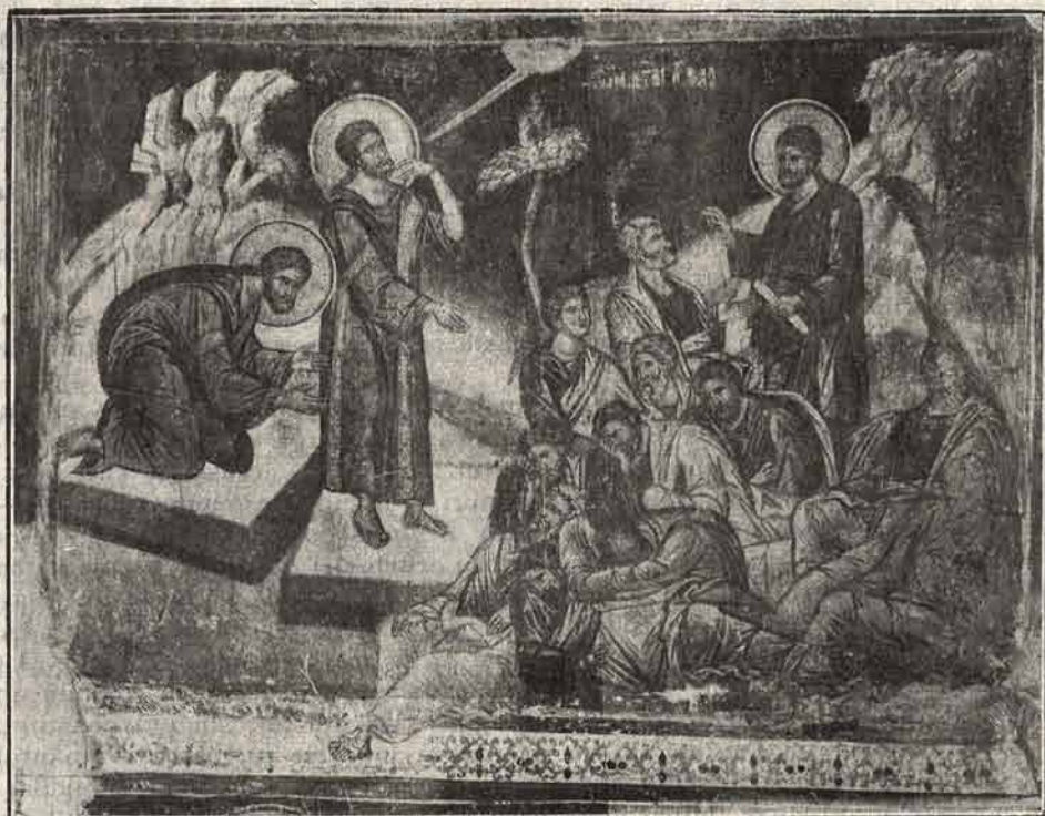
Rugăciunea cea de peste fire