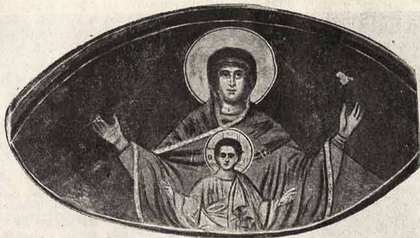
Maica Domnului (rugătoare)