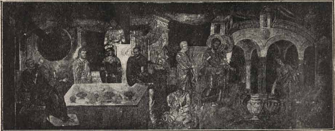
Minunea dela Cana