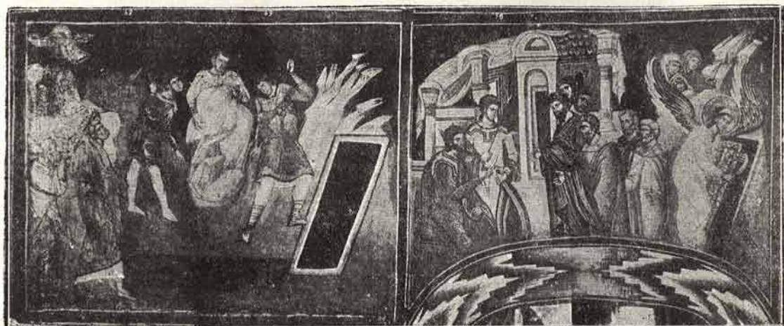
Ingroparea lui Hristos, și Iosif cere lui Pilat trupul Domnului