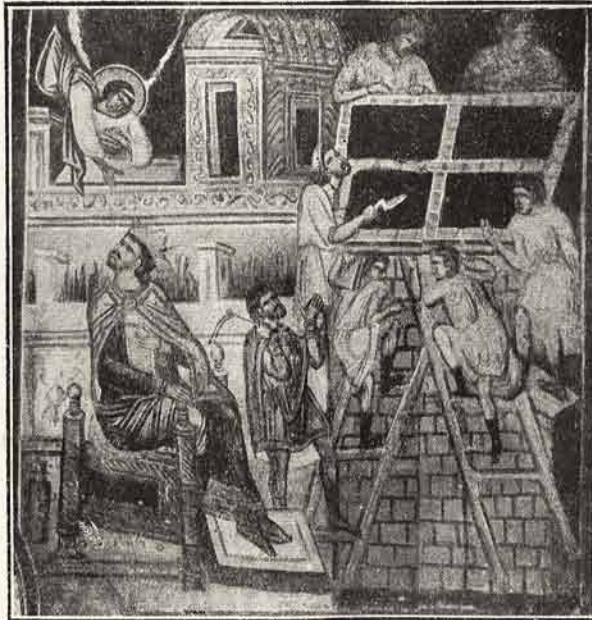
Pilda celui ce a zidit turn

De pe plaiuri părerile de tălângi se îndesiseră. Una răspundea țărâit și argintiu alteia și peste puțin, par'că anume ca să se asculte, tăceau o clipă toate. Pe sub geana cerului, prin colțane, grămăjui, grămăjui de puzderii albe se mișcau abia simțit. Oițele se scurgeau de vale, la iernatic în baltă. Pe urma lor, din dreapta și din stânga, și vetre, vetre, de pretutindeni, munții se aprinseseră și fumegau în stâlpi subțiri. Erau focurile ciobănești ale despărțirii. Iar pe povârnișuri, printre jnepeni întunecați, călinii în pâlcuri, galbeni ca lămâia sau roșii jărătic, ardeau liniștit de flăcările toamnei.