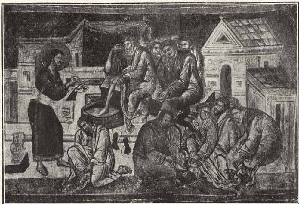
Sfânta spălare a picioarelor