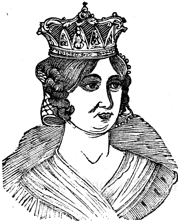
Агнес дѣла Цара 8нгѣрѣскѣ.

ва карѣ сз а гроапе кѣ амап пре чѣ маї пѣрадѣтѣ де минте. Кѣ аѣзїнаѣ кѣвїнтелѣ чѣле грѣле кѣ дезнѣдѣжѣїре кѣаѣ ла