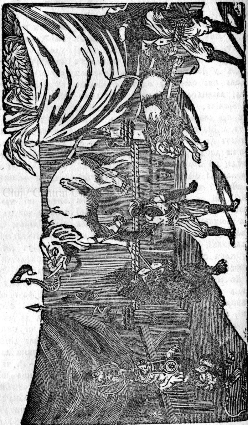
ΜΕΝΑΓΕΡΙΑ ΦΡΑΥΛΟΡ ΦΑΛΕΣ.

πῶς σὺ σὺ φάγε ὄμβρα ἔν ἰδέα ἀλ φρῶμ- || ἐλ ἀκὺ σὶ μαῖ μῶλτ πρὶν φῶπτῶρα ἔτ σεχίϊ χεῖ μαῖ δεσβῶρσῖτ, σὶ σὺ ριδίκκ || νοβλὺ ἀ τρῶπῶλῖ σὺσ σὺ ριδίκκ ἀχεστ πρεστε τοῦτε φῶπτῶρῖλε δε πρε πῶμῶντ; || ἀκοπερῶμῶντ ἀλ σὺφλετῶλῖ, ἀδεκκ ὄμβρα