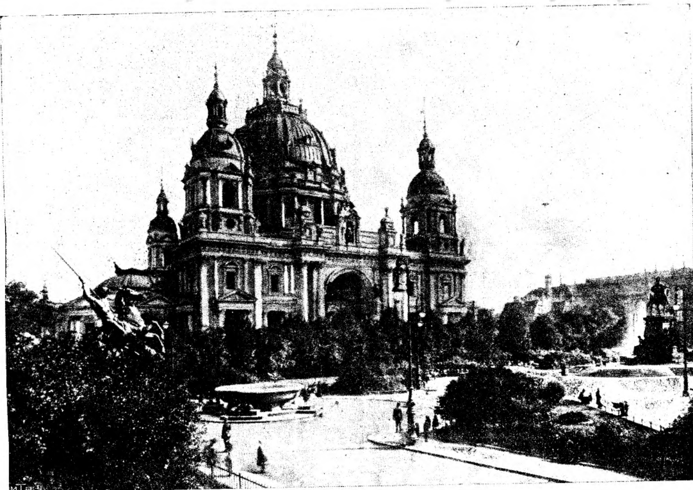
Noul dom în Berlin.