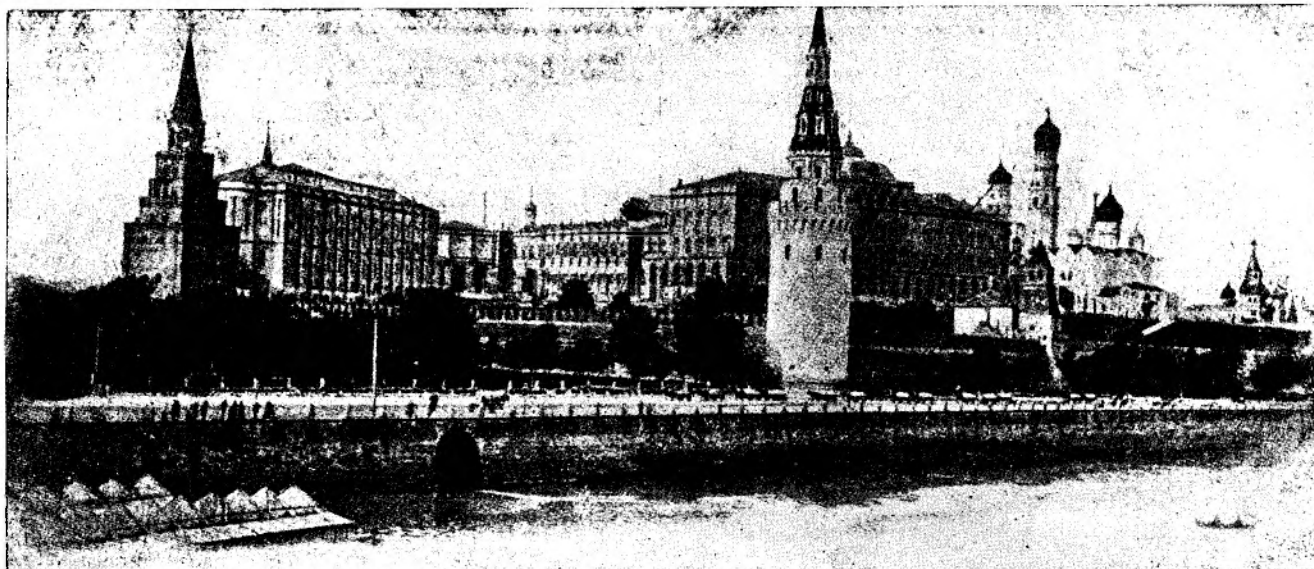
Palatul Kremlin în Moscva.

mai desmorți mânila la para focului, ațipi de slăbiciune.