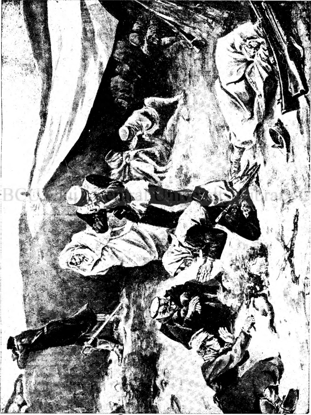
Din resboiul ruso-japonez.