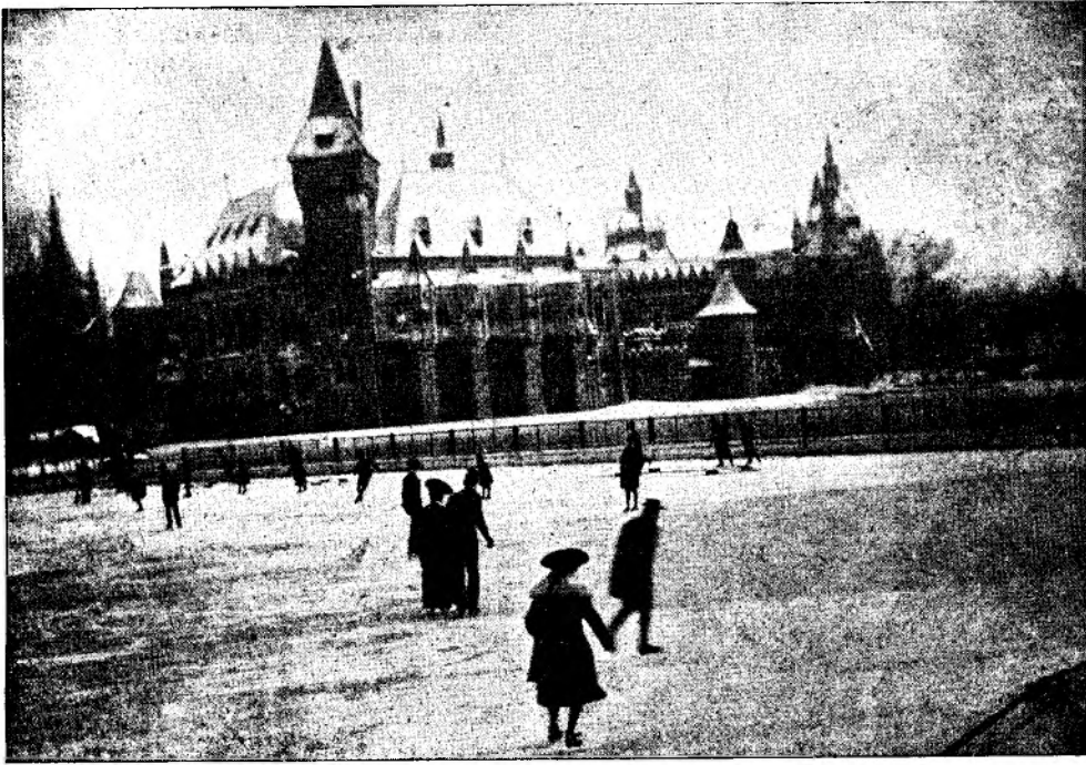
L a p a t i n a t.