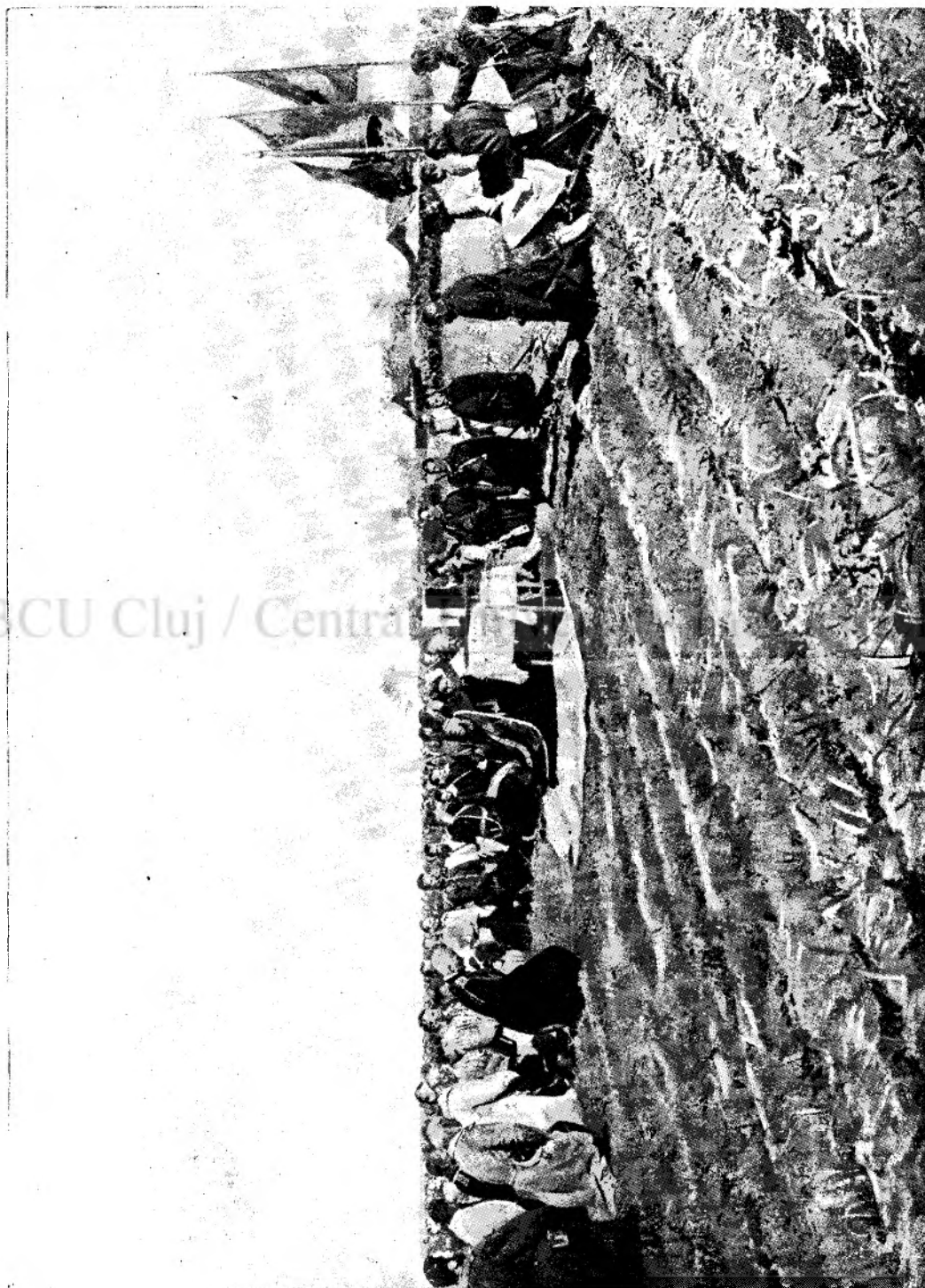
Liturghie în tabăra lui Kuropatkin la Mukden.