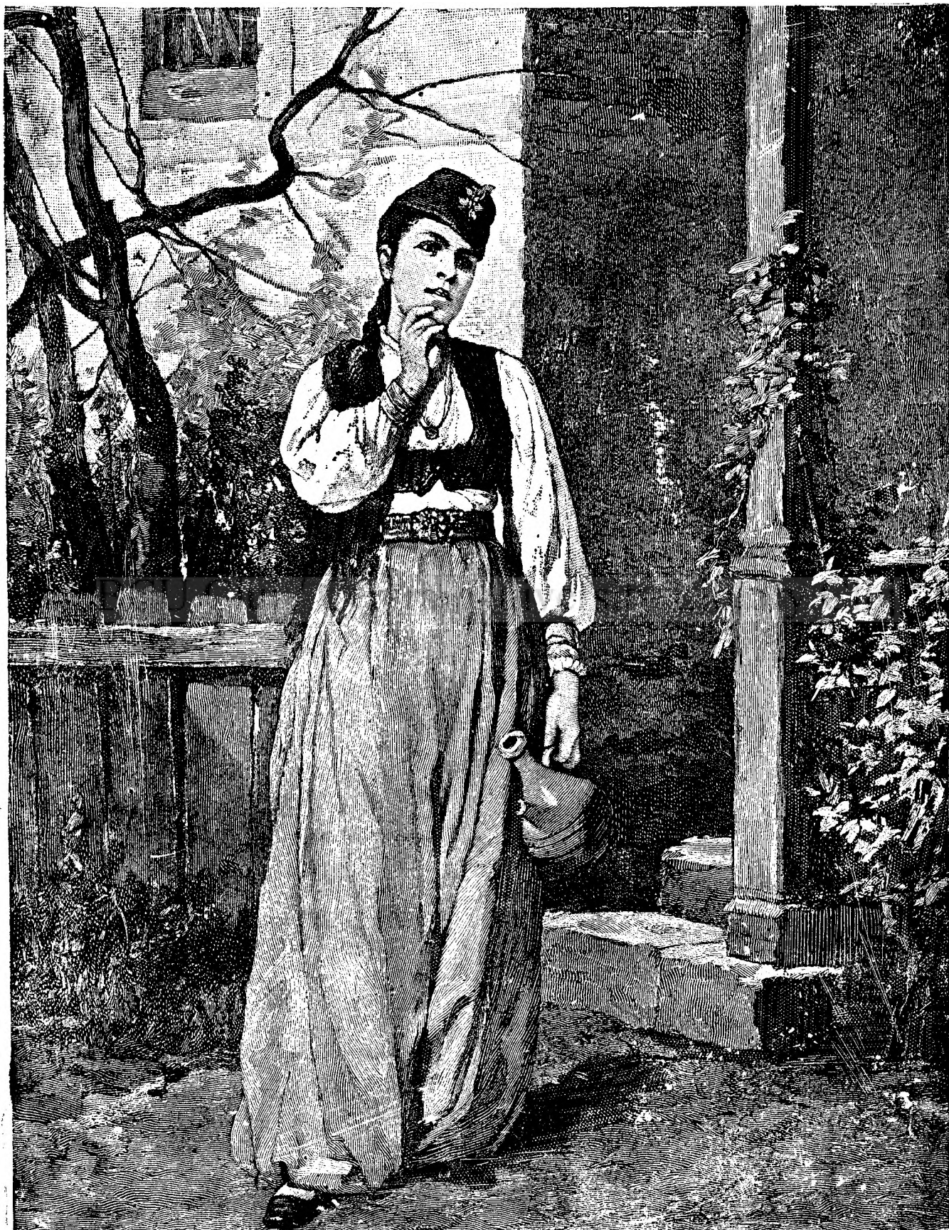
Bulgară de la Dunăre.