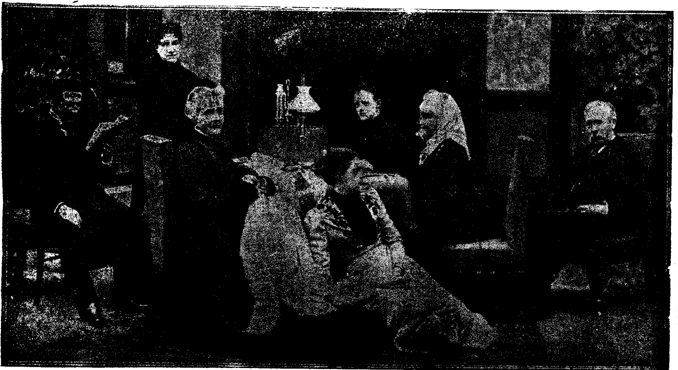
Carmen Sylva acasă.