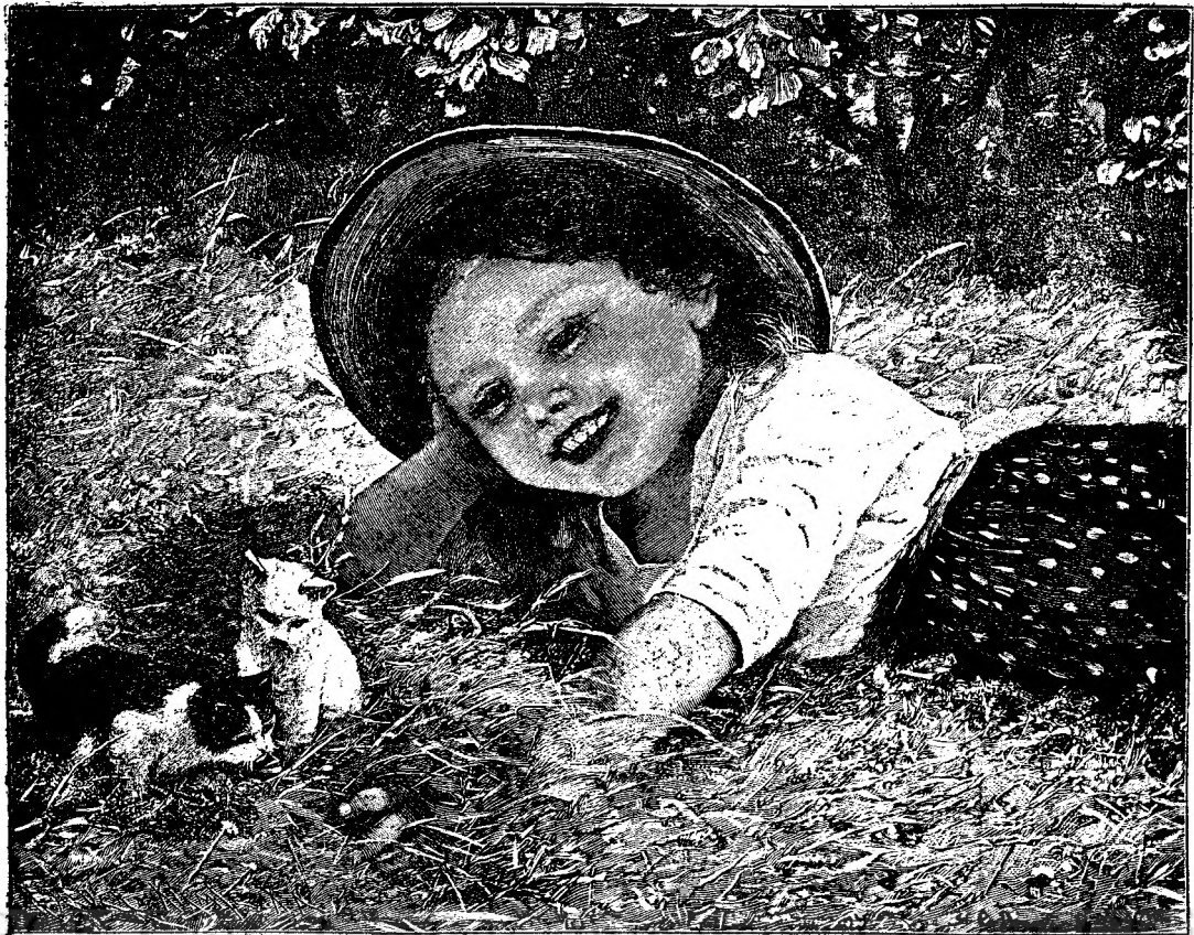
Pe iarba verde.