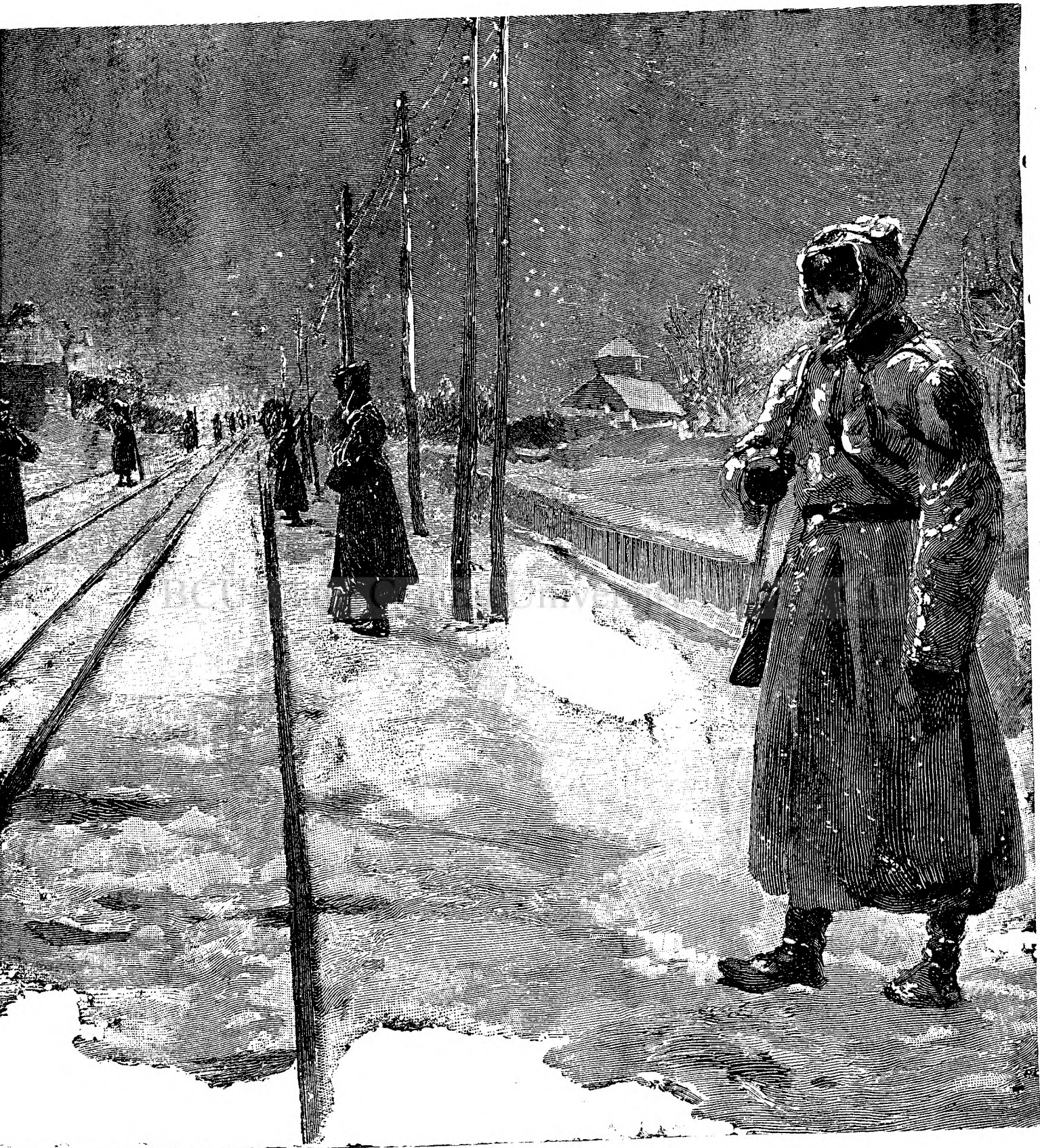
Când țarul călătorește.