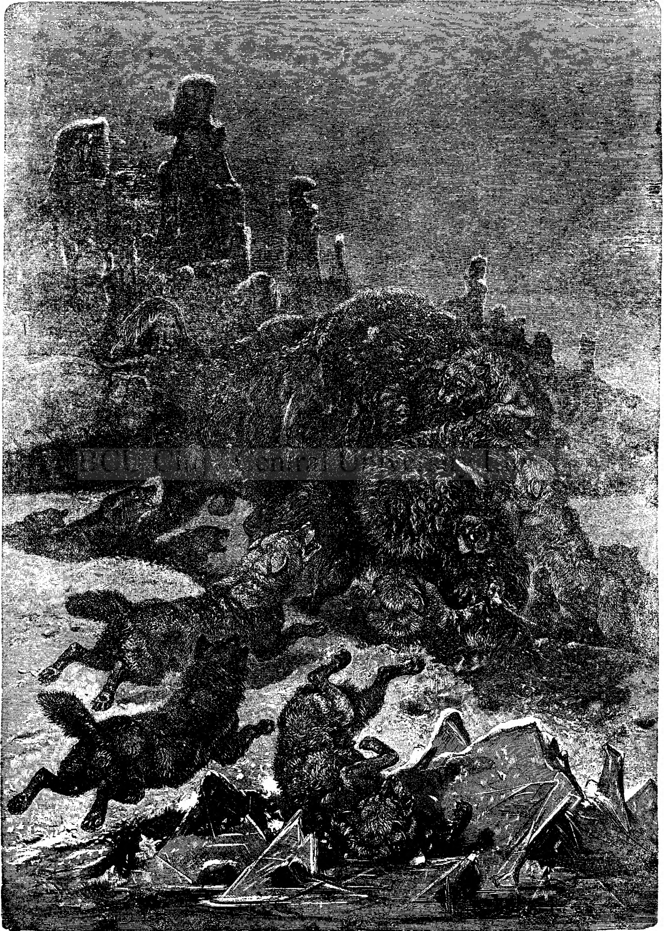
Lupta zimbrului cu lupii.