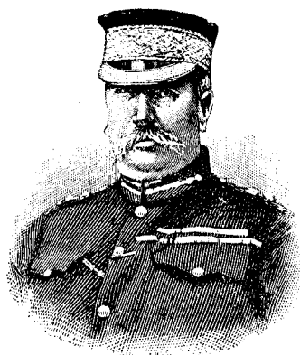
SIR REDVERS HENRY BULLER comandantul trupelor engleze din Africa.

El a călătorit din sat în sat, din comuna în comuna, predicând pretutindeni, îmbarbătând, stăruind și îndemnând pe cei instrăinați să se întoarcă (la uniune), arătând că numai în uniune e mântuirea, susținând cu căldură interesele uniunii, risipind temeră-