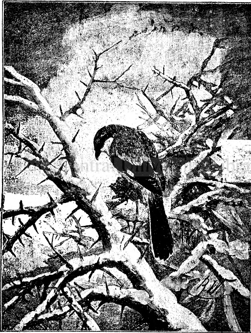
larna în pădure.

Exemple de ereditatea geniului avem: familia Bach care avuse peste 8 generații de copii talen-