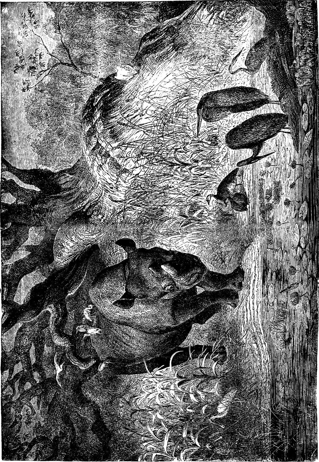
R I N O C E R U S.