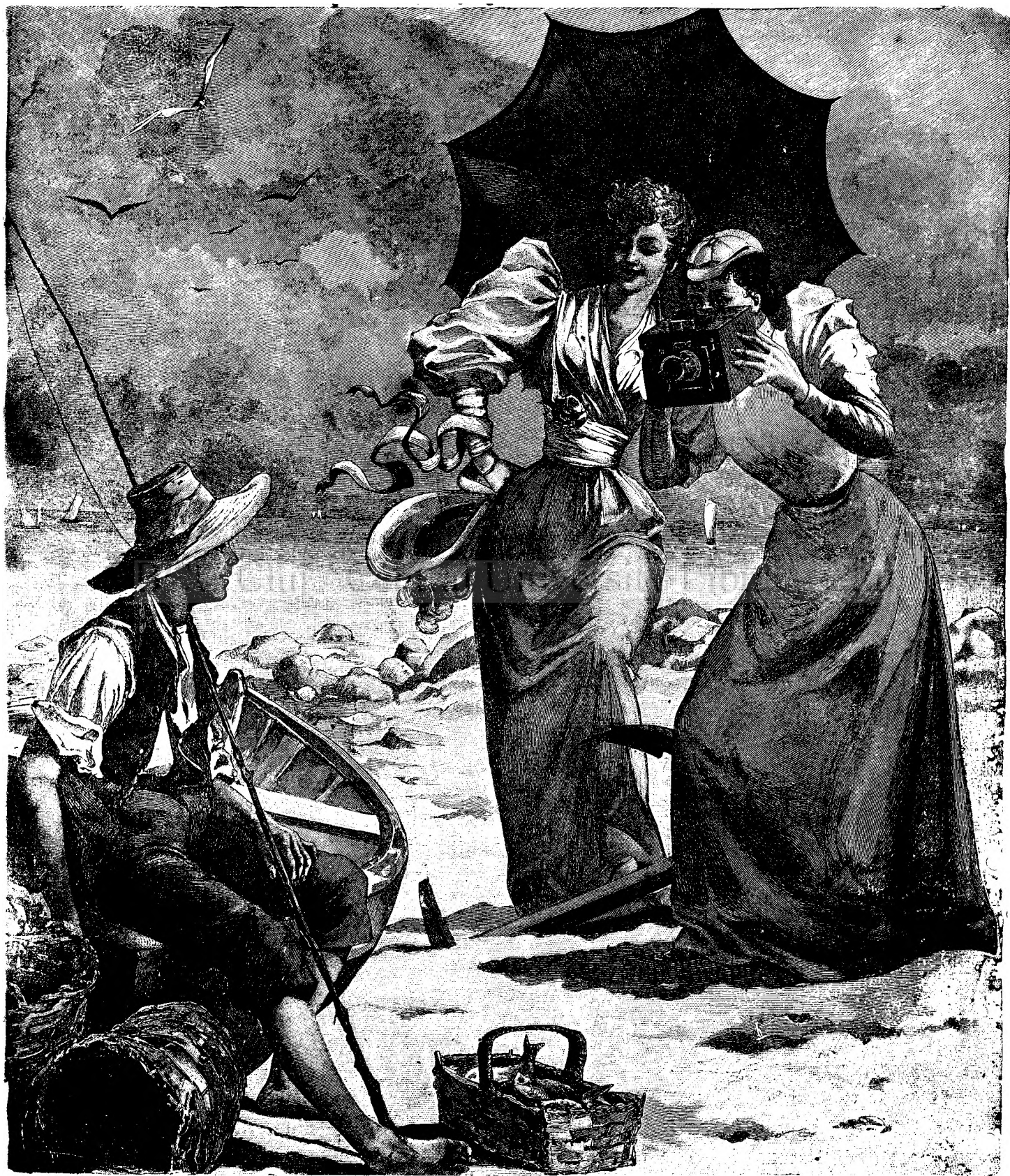
FOTOGRAFIARE LA MINUTĂ.