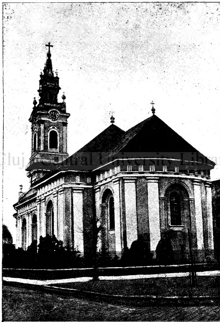
Catedrala gr. c. română din Oradea-mare.

Teatrul este cea mai bună oglindă a vieții care ne înfățișează fidel pe om cu toate virtuțile și slăbiciunile caracterului seti.