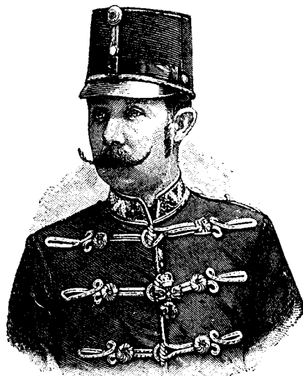
MOȘTENITORUL FRANCISC FERDINAND.