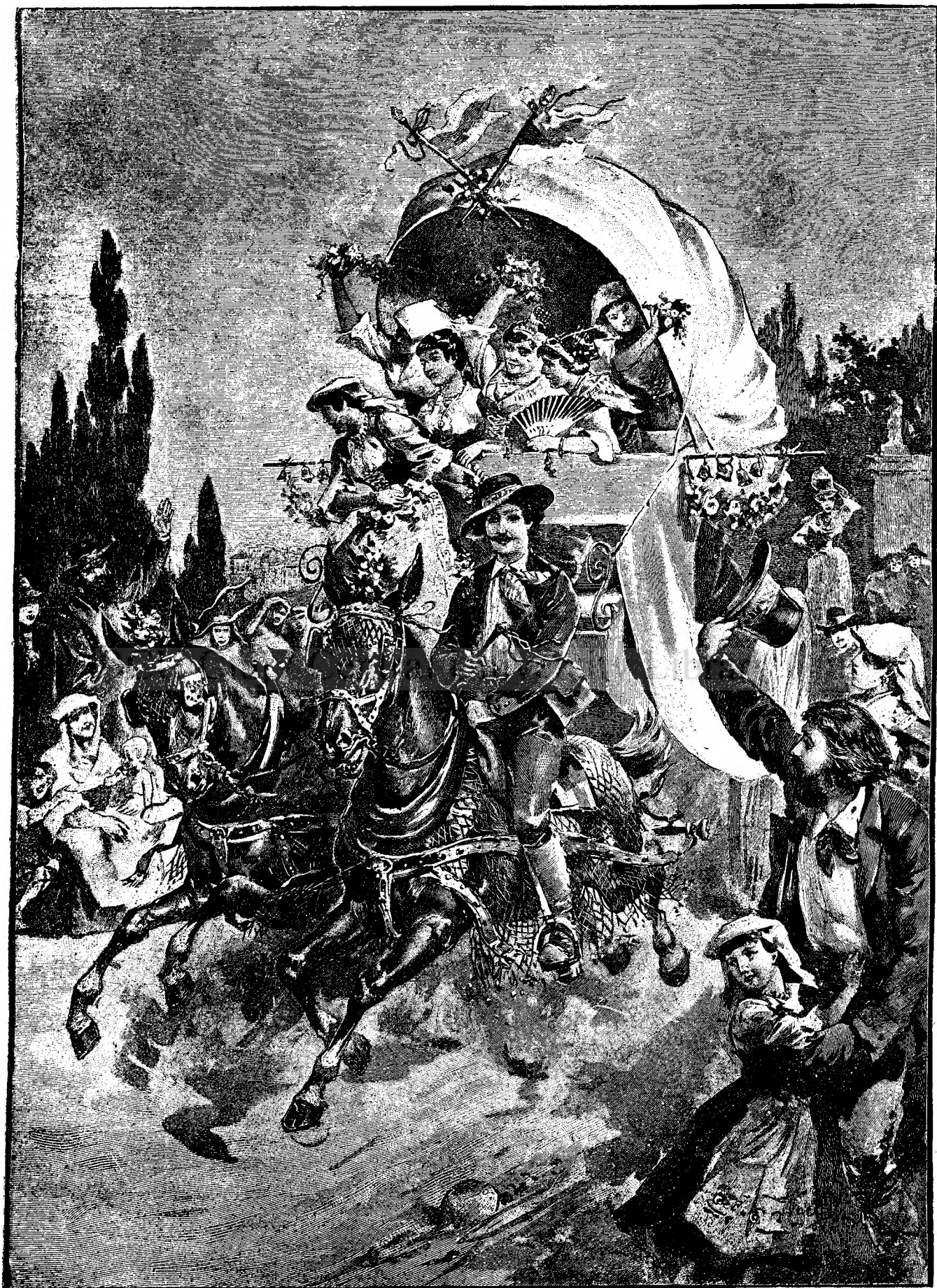
BĂTAIE CU FLORI ÎN AMERICA.