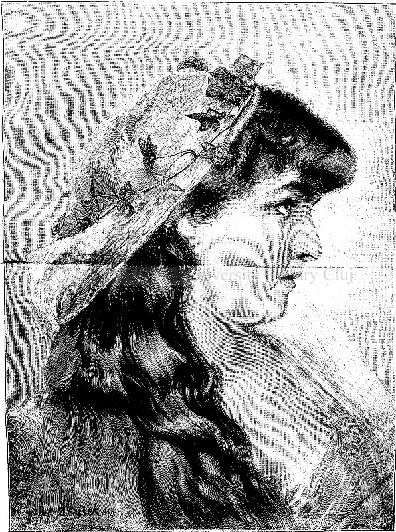
UN MODEL DE FRUMUȘETE.