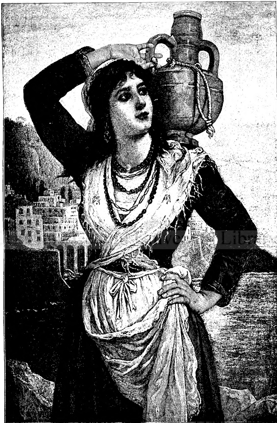
Italiancă aducând apa.