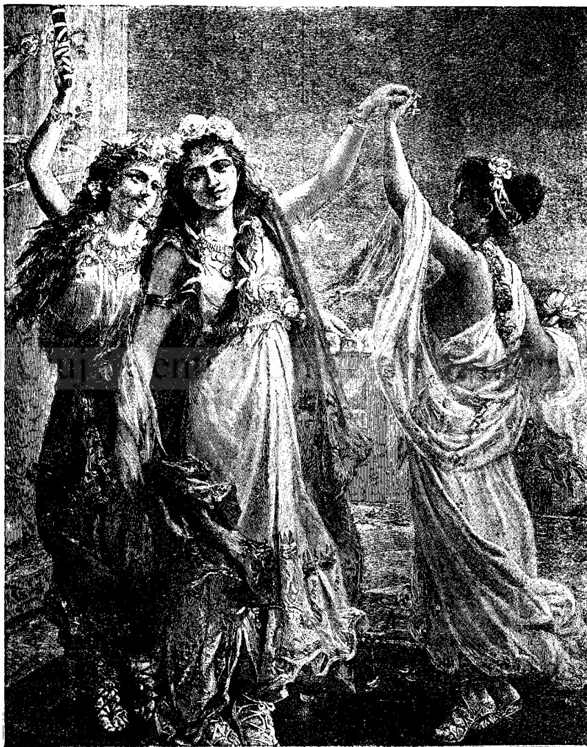
D a n s u l .

— Cred că vei ajunge la timp, până a nu închide banca. De s'ar întâmplă ca totuș să fie prea târziu, îi vei depune dimineață. Eu nu las bucuroși