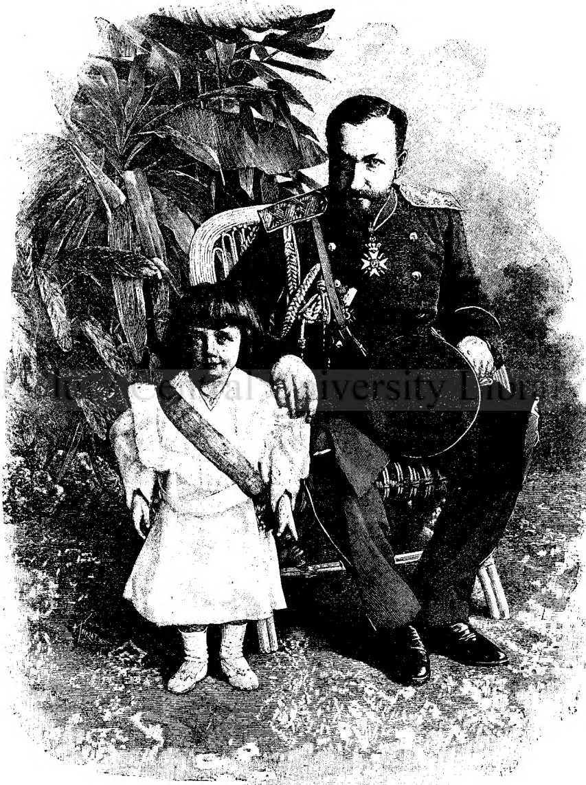
Prințul Ferdinand al Bulgariei cu fiul seū Boris.

— Lotti! strigaii eu; dar totuș cum putea fi