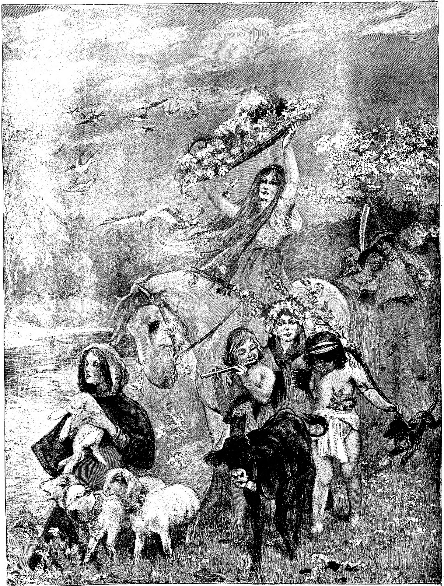
Z I N A F L O R I L O R .