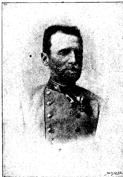
TEODOR CAVALIER DE SERACIN Locotenent-mareșal-campestru

După desființarea acestui regiment de graniță, a intrat de nou în statul major și din noiembrie 1872 până la finea lui aprilie 1873 a servit în despărțământul acestui stat major la comanda generală din Buda, iar din 1 mai până la finea lui octombrie ca profesor de tactică la Academia militară din Viena.