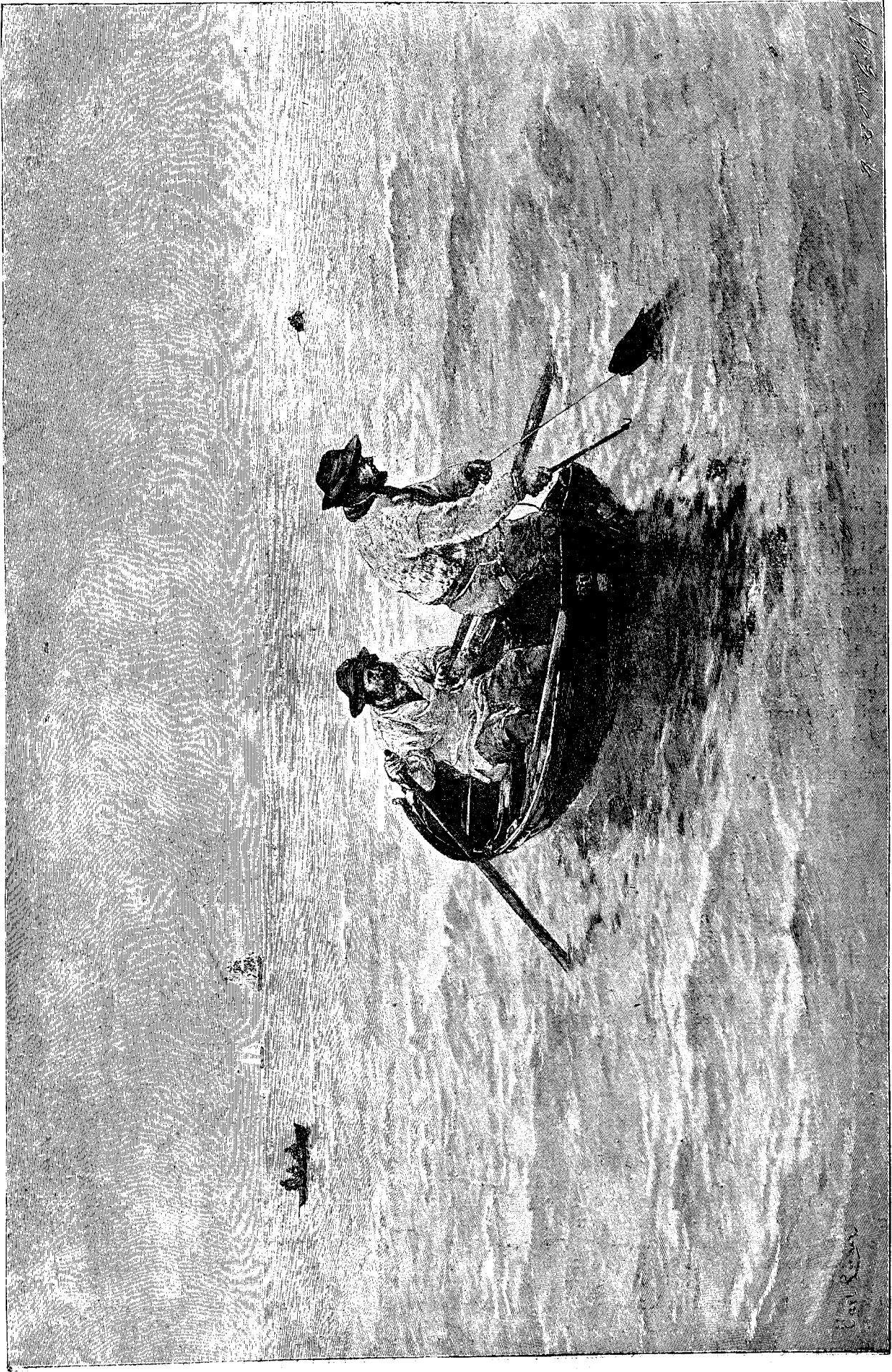
P E S C A R I T P E M A R E .