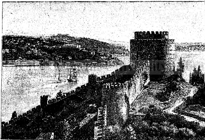
Întrarea în Bosfor.

Esența manifestărilor de voință, — ca iritări — n'o cunoaștem mai de aproape. Despre ele știm atîta, că transpunându-se ele asupra nervilor motori, provoacă schimbări resp. mișcări în mușchii resp. în organele cari stau cu nervii aceștia în legătură. Toate celelalte iritări (impresiile lumii esteriore) avem să le considerăm de niște mișcări fizicale, cari îndată ce ating vreun nerv, provoacă în acesta un proces anumit, adică îl aduc în stadiu de funcționare. Pentru ca în creierul nostru să se nască icoana luminei, e de trebuință ca vre-o rază a luminei să atingă retina, adică acea parte a ochiului, care nu e altceva, decât estensiunea nervului optic (de vedere). Raza iritează nervul