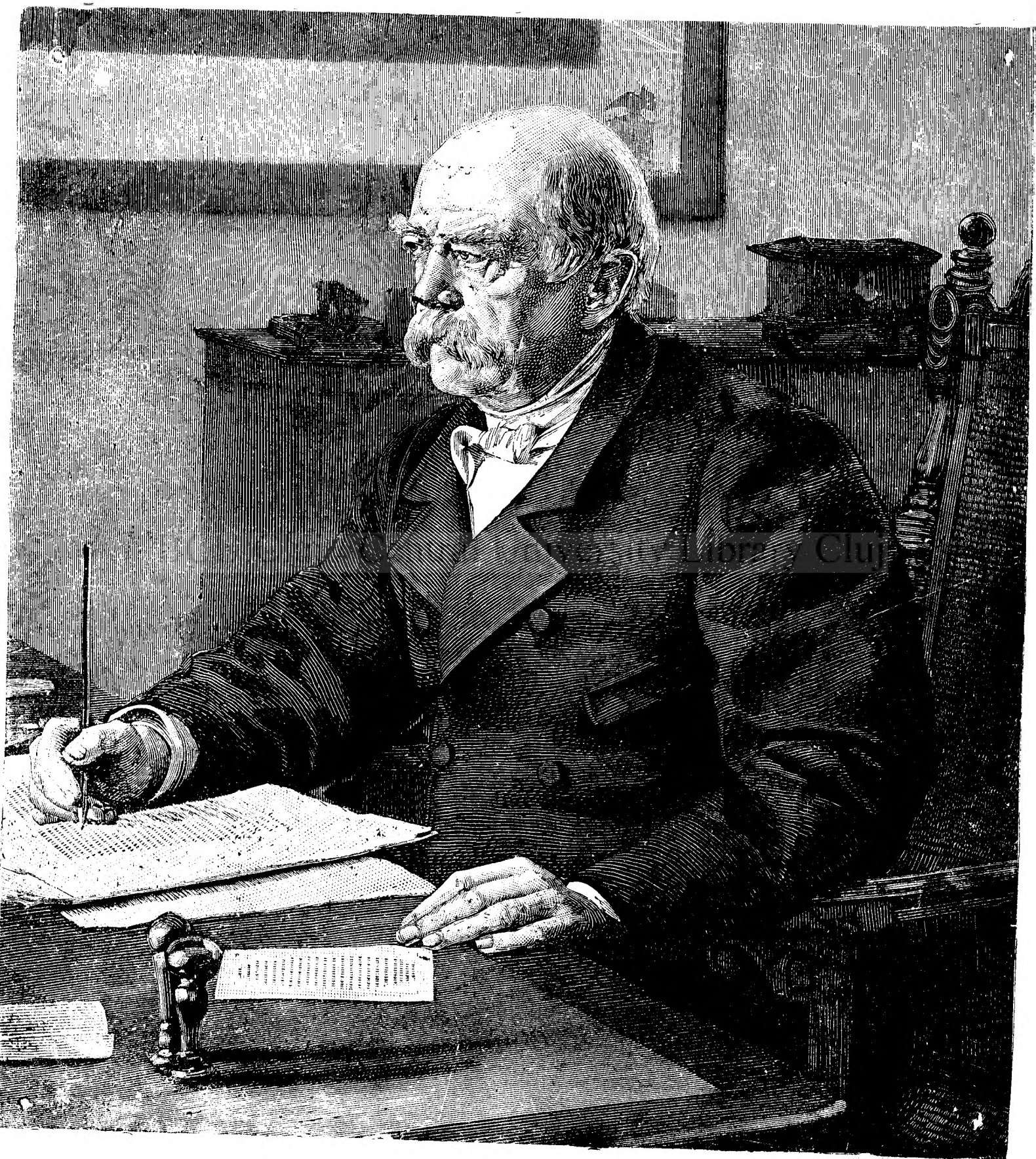
BISMARCK IN CABINETUL SEU DE LUCRU.