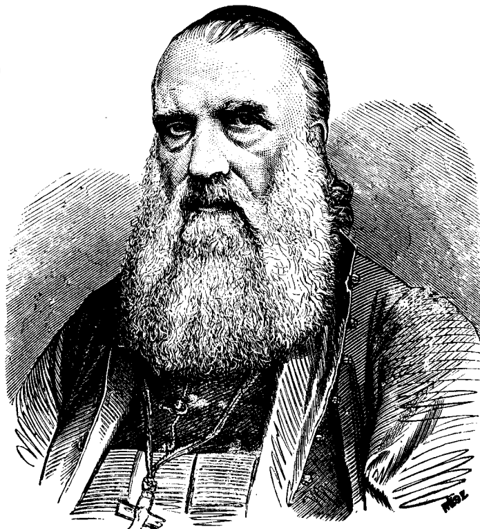
ANDRIEU BARON DE ȘAGUNA.

Un parastas deosebit solemn se va aranja în biserica cea mare din Reșinari, lângă care e situată cripta cu osămintele fericitului arhiepiscop și mitropolit, tocmai în ziua când se împlinesc 25 de ani de la moartea lui, adică în 16/28 iunie, și la care au să asiste credincioși din toate părțile provinciei mitropolitane, dimprună cu alți frunțași cari se vor duce anume pentru privilegiul acela, căci serbarea memoriei unui bărbat mare cum a fost Șaguna, nu este numai a unei confesiuni, ci a întregii națiuni române.