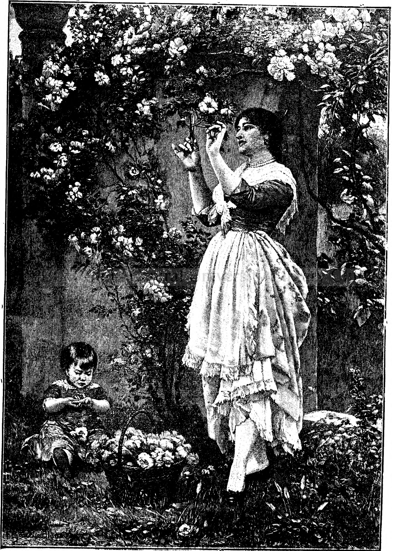
I N T R E F L O R I .