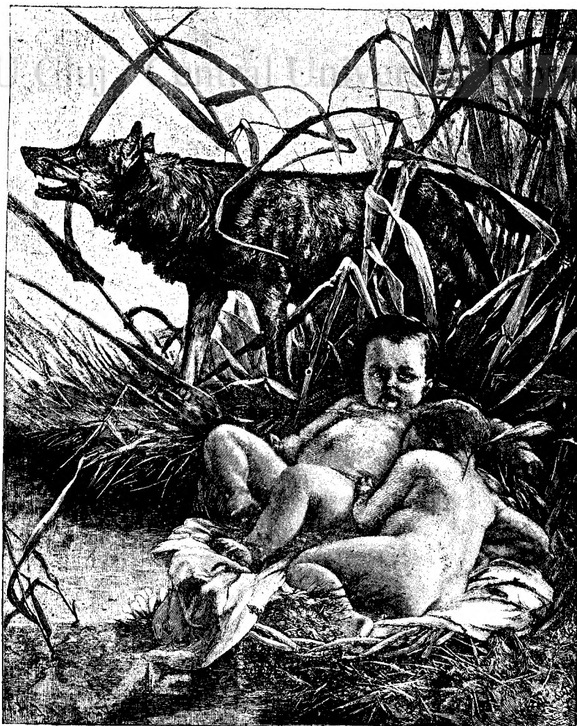
ROMULUS ȘI REMUS.

de 19 ani, dar destul de bine înarmat, ca în studiile teologice să-și elupte primul loc între colegii și să rămână în tupaștrii anii tot primul eminent, precum mărturisește Protocolul clasificățiunilor pentru ascultătorii studiilor teologice în seminariul diecesan din Blaș. Calculii lui de aici sânt cei mai esceleți.