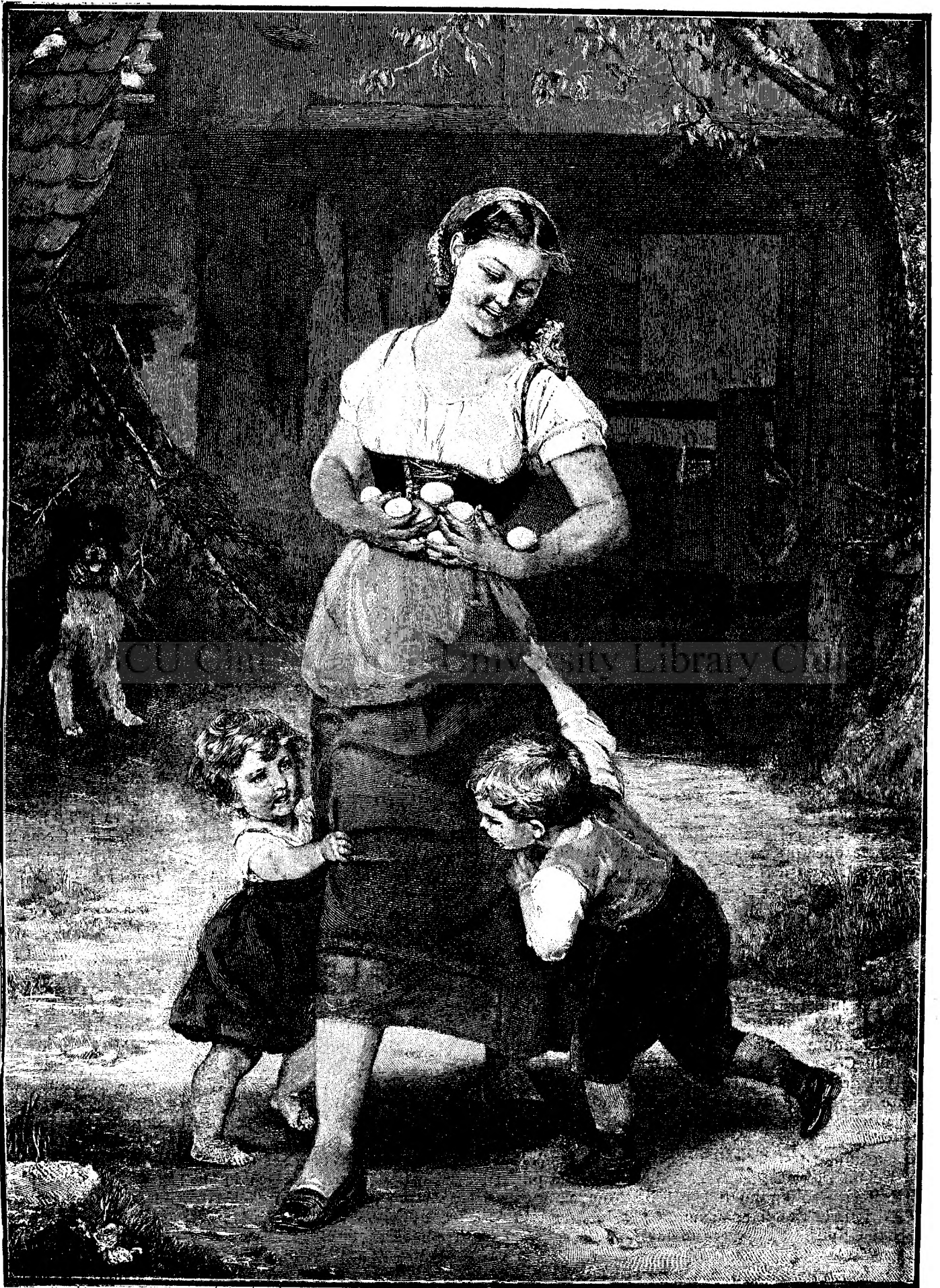
O U E D E P A Ş C I .