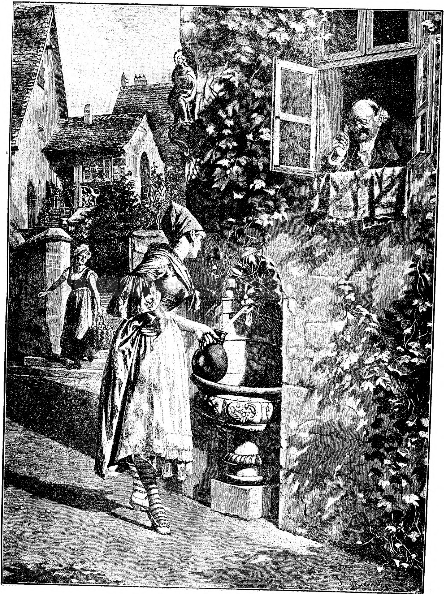
V U L P E A B E T R A N A .