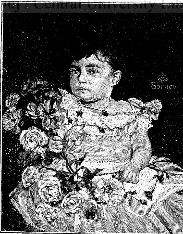
PRINȚUL BORIS AL BULGARIEI.

— Lasă că nu e nimic, Bicilis, ținse dënșă! Nu le pasă umerilor mei; îndură ei dureri!