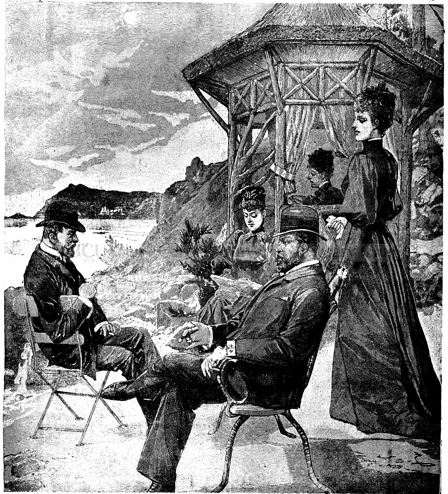
Principele de Wales și familia sa.