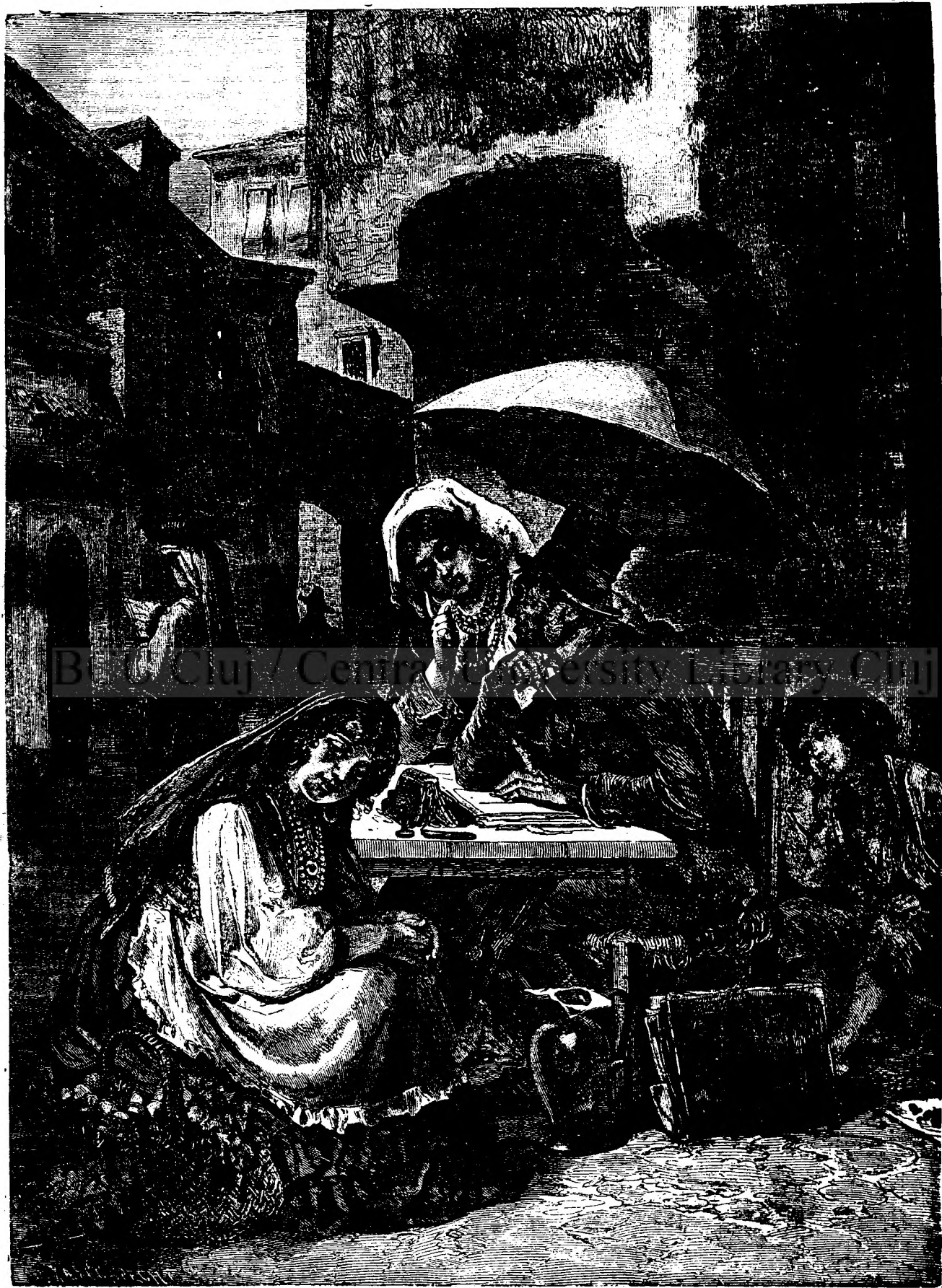
Cancelist de piață in Roma.