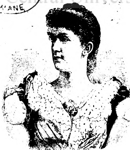
VEDUVA LUI STAMBULOV.