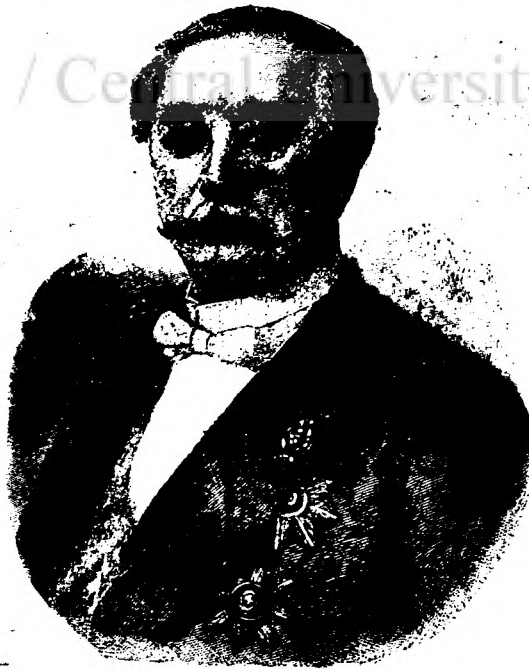
PRINCIPELE ALESANDRU LOBANOFF-ROSTOWSKI noul ministru de esterne al Rusiei.

El ascultă zimbând vorbele ce se șoptiau și dojenile ce i se făceau, și nu răspundea nimic; dar se vedea că zimbetul era silit și par că totdeauna un nor i s'ar aședă pe frunte, ceea ce stérniă și mai mult mâncărimea limbilor rele.