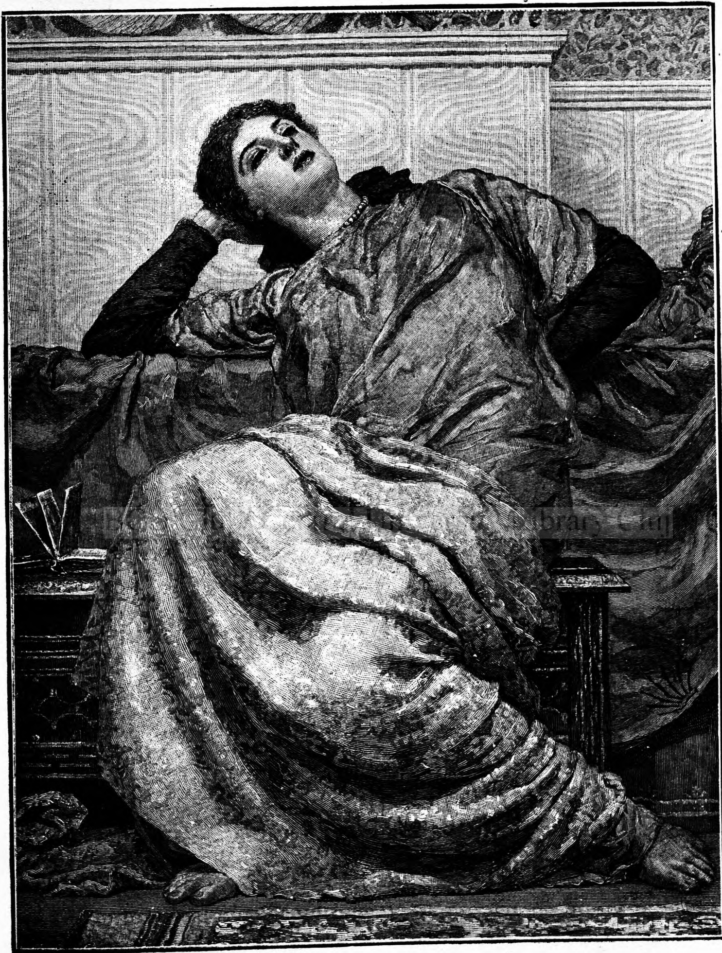
Inaintea cărții deschise.