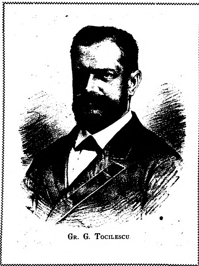
GR. G. TOCILESCU.

— Bine darā — adau- ge moș Cailean ridicān- du-se în piciōre — când ȓi vini la mine, ȓi gāsi cu bună samā în cāmā-