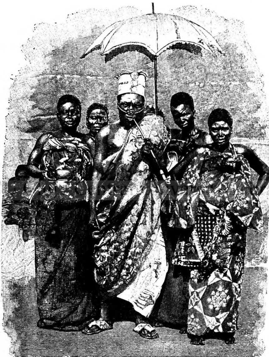
NOUL REGE DE DAHOME ȘI NEVESTELE SALE.

Ai cugetă, că în astfel de locuri e imposibil să trăeșcă ființe omenești, cugetând inșe astfel te inșeli, că asemenea paserilor cerului retrase în visuiunile lor, își au și munții aceștia neroditori visuiunile așa numite: doline, cari sunt locuite de ômeni. În mod sporadic, înprăștiați ca fărina orbului prin locuri, ce au formă de căldare, în comune câte din 35—40 case se află grupați locuitorii muntelui Karst.